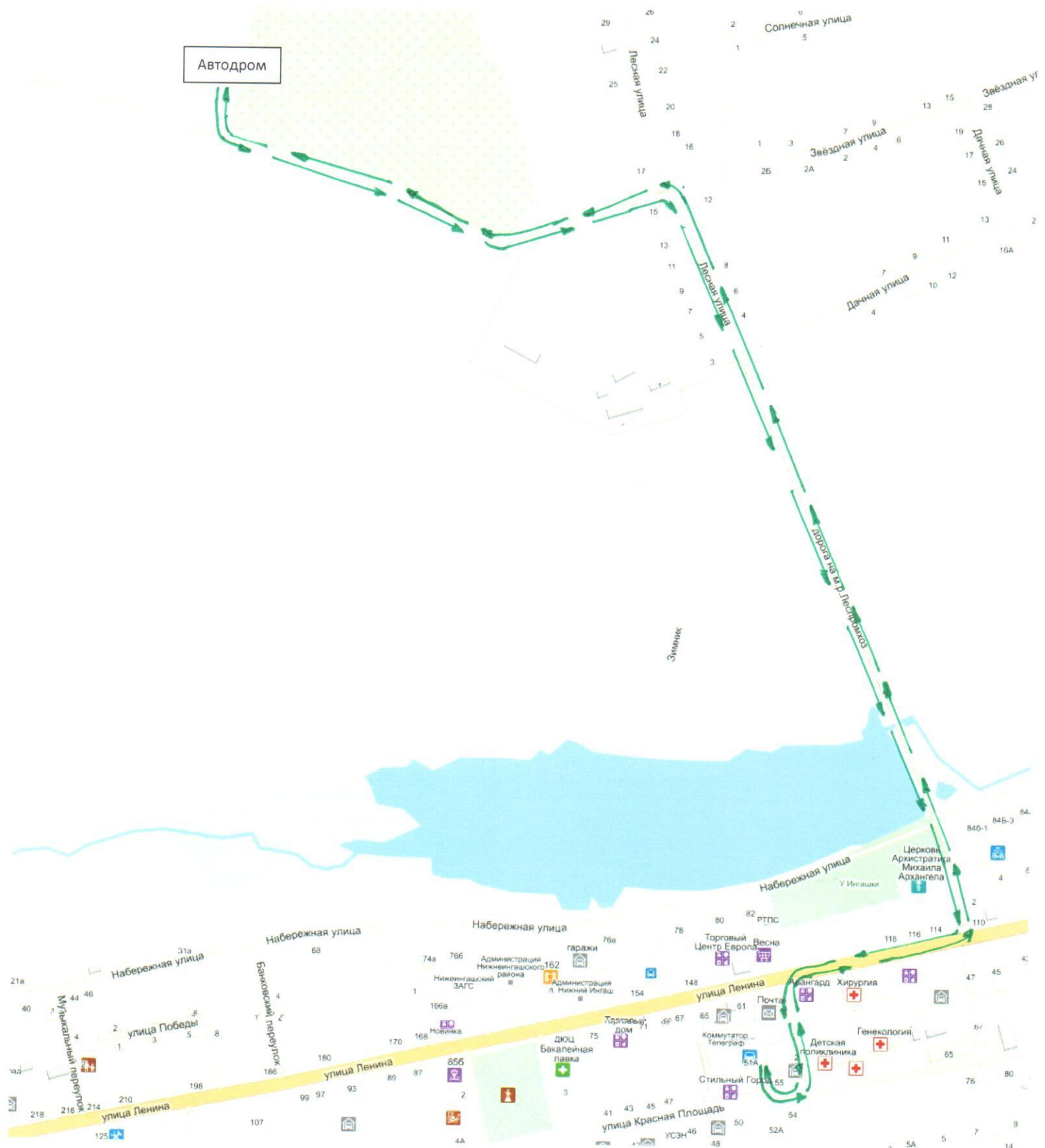
Схема учебного маршрута № 4 категории «В» по поселку